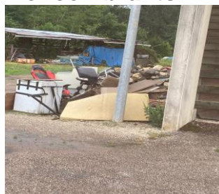
Derrière les ateliers municipaux

Les dégradations continues sur les bâtiments communaux nous concernent tous car ce sont des coûts supplémentaires pour les remplacer, et occasionnellement un travail supplémentaire pour les agents municipaux.